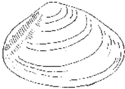
លៀសសំបករឹង

ពីព្រោះសត្វមានសំបកដែលមានកំណរក្រខ្វក់មិនមានអ្វីខុសប្លែកគ្នាពីសត្វមានសំបកដែល មានសុខភាពល្អទេ ដោយគ្រាន់តែមើលឃើញសត្វមានសំបកនេះ គេមិនអាចកំណត់ថាវា នឹងមានសុវត្ថិភាពសំរាប់បរិភោគឬយ៉ាងណាទេ ។ ការចម្អិនសត្វមានសំបកនេះឱ្យឆ្អិនត្រឹម ត្រូវអាចបន្ថយគ្រោះថ្នាក់នៃជំងឺខ្លះៗ ប៉ុន្តែគេមិនអាចធានាថាសត្វមានសំបកដែលយកបាន ពី Boston Harbor សុទ្ធតែមានសុវត្ថិភាពសំរាប់បរិភោគទាំងអស់ទេ ។ ទូរស័ព្ទមកវេជ្ជ បណ្ឌិតណាម្នាក់ បើសិនជាអ្នកមានជំនឿថាអ្នកប្រហែលបានបរិភោគសត្វមានសំបកដែល មានកំណរក្រខ្វក់ ។