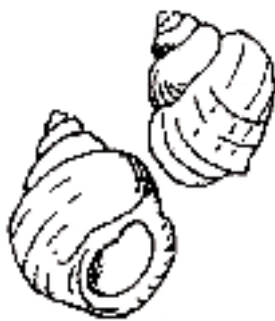
សត្វមានសំបកតូចៗ (ខ្មៅ)

សត្វមានសំបកនៅក្នុងតំបន់ Boston Harbor អាចមានកំណរក្រខ្វក់ជាមួយបាក់តេរី វីរុស និងជាតិគីមី ។ រោគសញ្ញាពីការបរិភោគសត្វមានសំបកដែលមានកំណរក្រខ្វក់ មានរួមដូចជាក្អក ចង្ហោរ រាគរូស ឈឺពោះ ត្រជាក់រងារ និងគ្រុន ។ ជំងឺរលាកច្រើមជំពូក A (ជំងឺច្រើម) និងជំងឺធ្ងន់ធ្ងរដទៃទៀតក៏អាចបណ្តាលមកពីការបរិភោគសត្វមានសំបកដែលមានកំណរក្រខ្វក់ដែរ ។